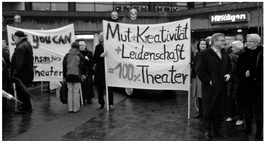
Abb. 3. Im Seidenweberhaus tagt der Stadtrat. Draußen demonstrieren die Theaterfreunde gegen die knappe Finanzierung der Vereinigten Städtischen Bühnen.