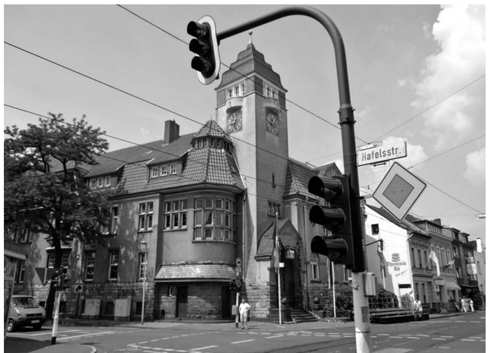
Abb. 1. Fischeln's Rathaus feiert bald 100. Geburtstag. Nun werden Fassade und Rathausgarten instandgesetzt.