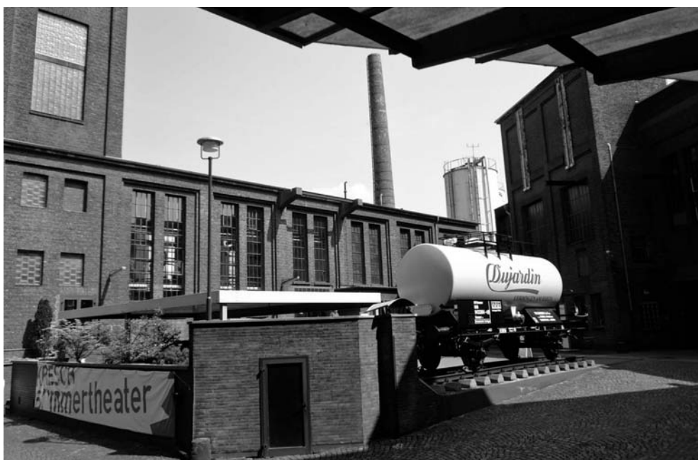
Abb. 5. Neues Leben in der Industrie-Ruine. Die Dujardin-Erben verwandeln die verwaisten Hallen in eine „Event-Location“ mit Museum.