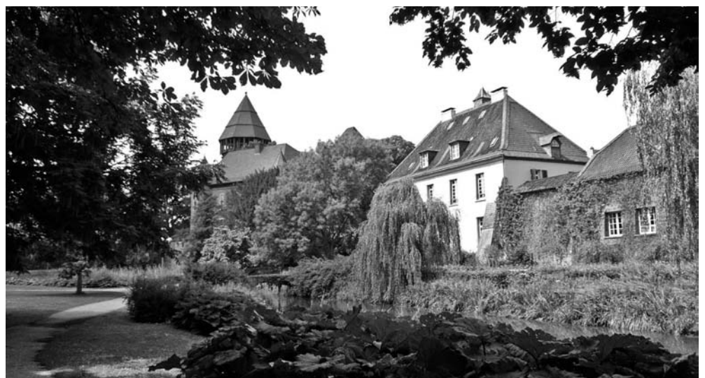
Abb. 4. Idylle im Sonnenschein – aber: Die Gebäude zeigen Risse. Durchs Dach des Jagdschlösschens dringt Regenwasser ein. Aus dem Bundes-Konjunktur-Topf soll Reparaturgeld fließen.

Im August ist nach langwieriger Sanierung das Uerdinger Rheintor fertiggestellt. Die Moschee-Gemeinde von der Sprödenalstraße will die jüdische Gemeinde zum Besuch einladen. Während der Ausstoß anderer Brauereien sinkt, steigen die Absatzzahlen der Königs-