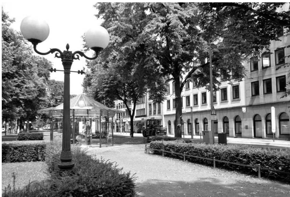
Abb. 2. Rund 250 von 1200 Metern Ostwall sind saniert. Über die Gestaltung der Kreuzung Rheinstraße und der Haltestelle wird munter diskutiert.