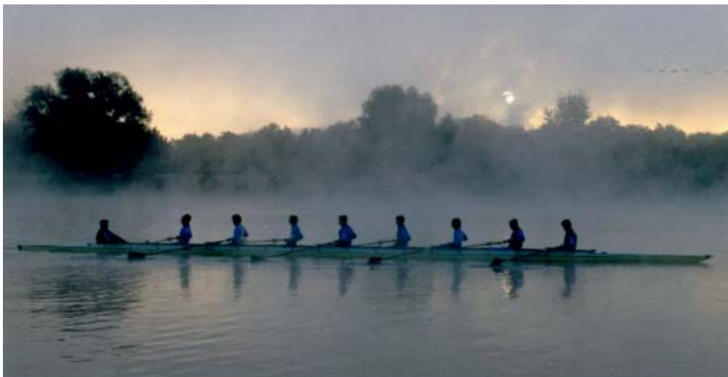
Abb. 9. Eine Impression vom Elfrather See

in bester Verfassung dar. Um die 350 Mitglieder – 100 davon in der Jugendriege – geben ihm das feste Fundament. Der Vorwurf, er sei ein elitärer Oberschicht-Club, kann heute nicht mehr aufrecht erhalten werden. Der Bootspark ist bestens gefüllt, die Häuser am Elfrather See und am Rhein – letzteres wird gerne als „Mutterhaus“ bezeichnet – bewähren sich. Die Bilanz, die zum 125-jährigen Jubiläum gezogen werden kann, ist in jeder Hinsicht eindrucksvoll.