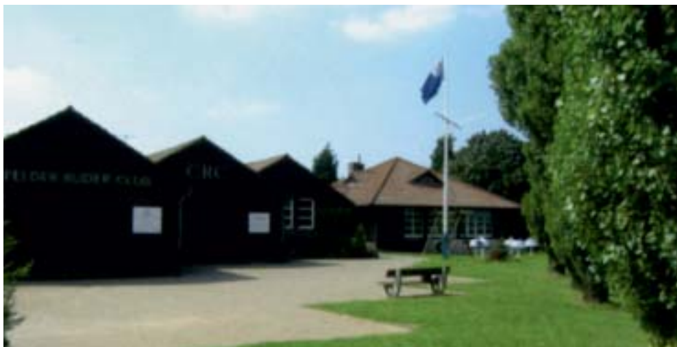
Abb. 8. Das heutige Bootshaus an der Batavestraße

Das alte, in den Jahren 1906/1907 erbaute Haus am Hafen ist für die älteren Mitglieder eine unvergessene Bleibe, aber 1979 wurde klar, dass es der städtischen Hafenplanung im Wege stand und aufgegeben werden musste. 1982 wurden Haus und Grundstück an die Stadt verkauft; es folgte der Erwerb des neuen, 700 Meter rheinaufwärts gelege-