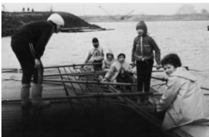
Abb. 6. Kinderrudern auf dem Elfrather See, 1975