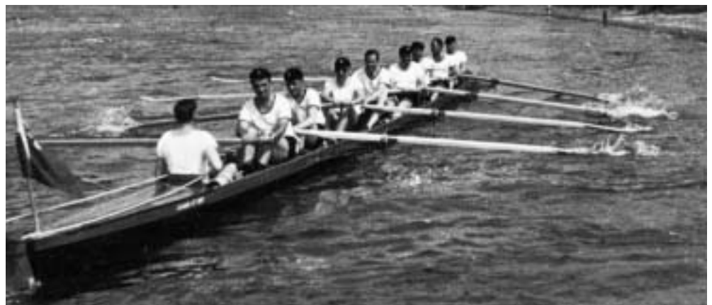
Abb. 3. Jungfernfahrt des neuen Achters, 1955

Die folgenden Jahre können nur noch im Telegrammstil abgehandelt werden. Einige Namen, Daten und Fakten seien kurz genannt, die aus der Sicht der Stadtgeschichte besonders berichtens- und festhaltenswert erscheinen. 1952 verfügte der Verein wieder über sieben Boote, 1954 fand die erste Nachkriegs-Regatta im Hafen statt mit Teilnehmern aus Bonn, Düsseldorf und Uerdingen. Von sechs Rennen gewann der Crefelder Ruder-Club nur eins, in den restlichen fünf siegten die Boote des Uerdinger Ruder-Clubs, zu dem im Allgemeinen gut nachbarschaftliche Beziehungen bestanden. Bezeichnender Weise wurde der erste Achter, den der Verein 1955 anschaffte, durch den damaligen Oberbürgermeister Johannes Hauser auf den Namen „Krefeld-Uerdingen“ getauft; für dieses