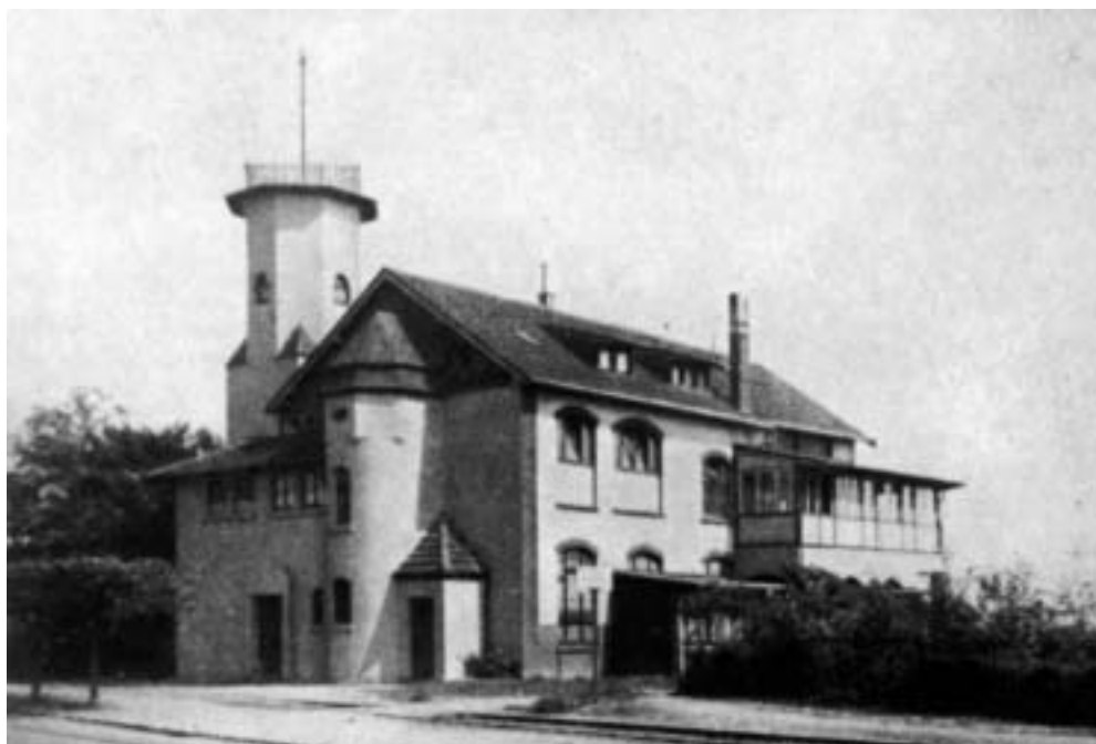
Abb. 2. Das feste Bootshaus am Rheinhafen

Die Geselligkeit wurde beim Crefelder Ruder-Club von Anfang an groß geschrieben und hat in vielen wahren, ausgeschmückten oder erdichteten Geschichten ihren Nieder-