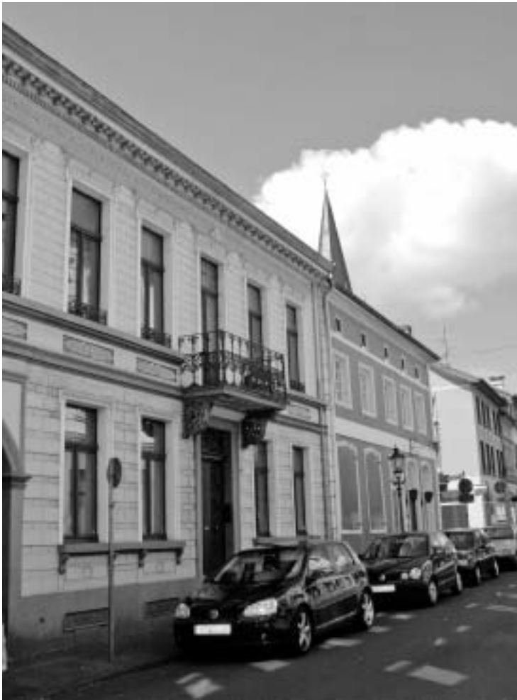
Abb. 2. Haus am Rheintor: Geburtshaus von Margarete Böing