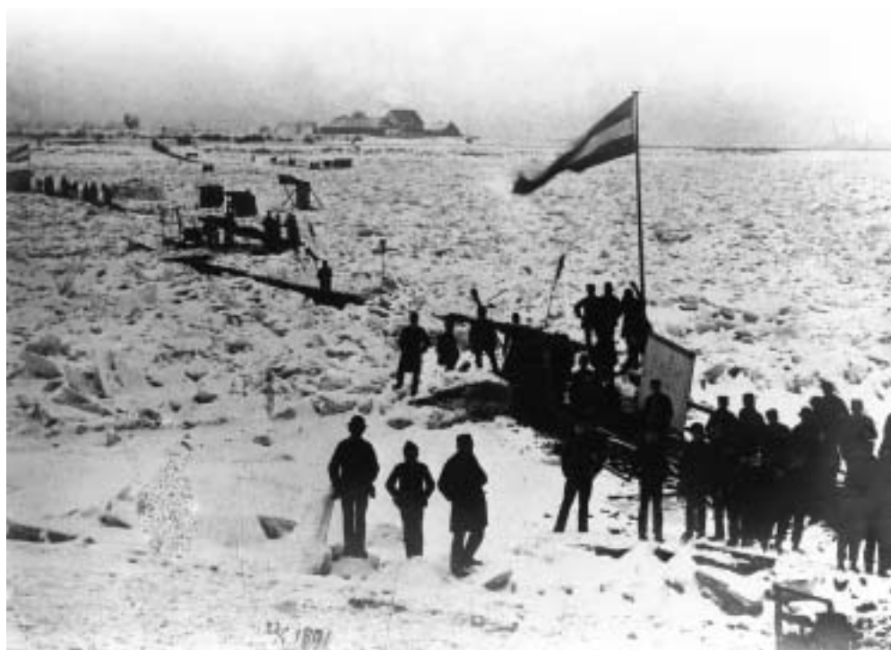
Abb. 6. Eisgang bei Uerdingen, 1891