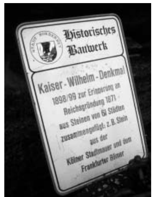
Abb. 4. Inscriptplatte