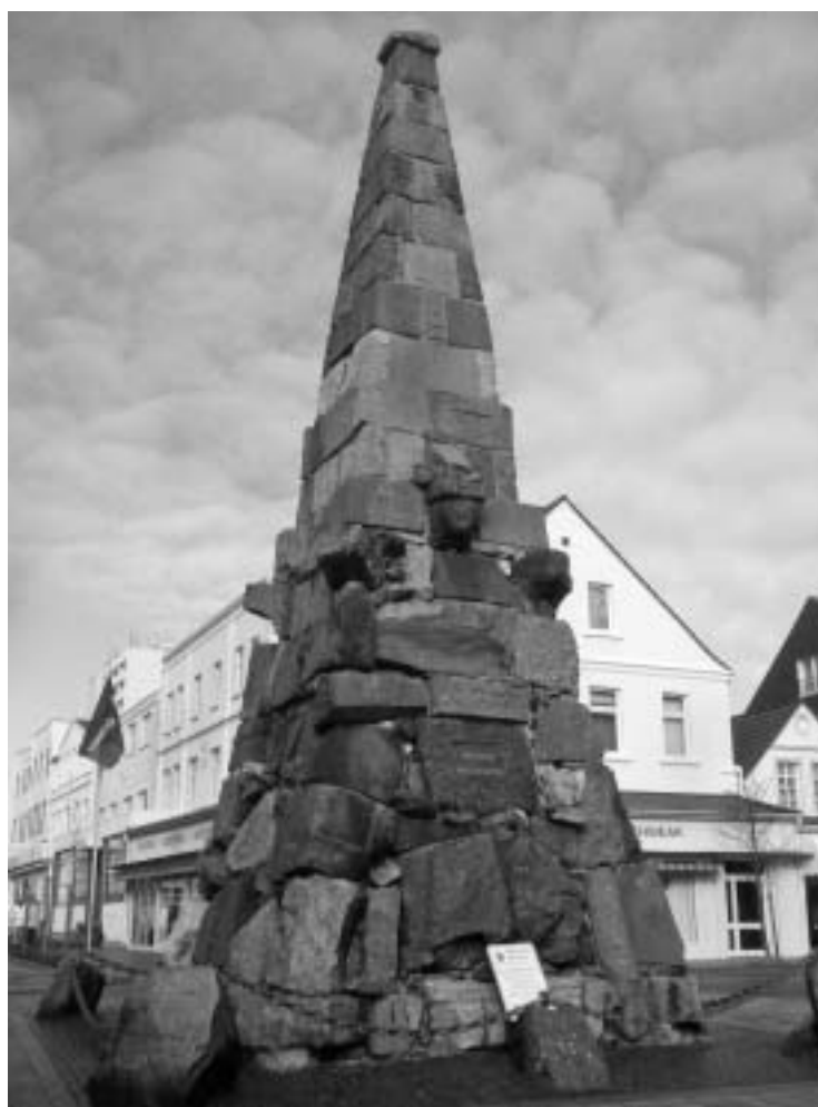
Abb. 1 + 2. Kaiser-Wilhelm-Denkmal auf Norderney.