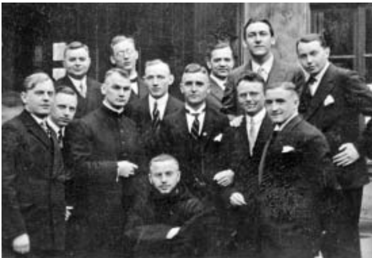
Abb. 3. Primizfeier mit Freunden bei Bruns, Kölner Straße, Ostern 1929