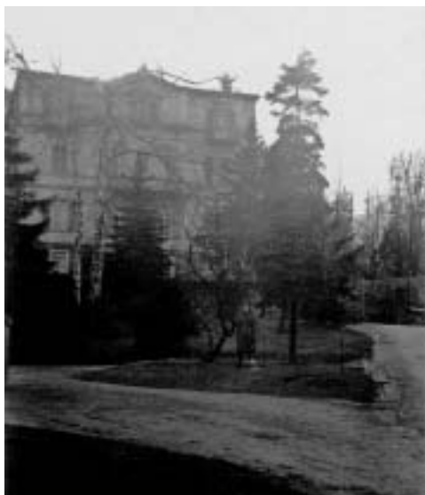
Abb. 1. Bad Kissingen, Haus St. Ursula. Winter 1943/44

zum Haus gehörenden Garten und bequem auch in einen höher gelegenen angrenzenden Wald. Diese eigene Tür ins Freie war in unseren Augen ein unerhörter Vorzug! Als Vertrauensbeweis für ihre älteren Schülerinnen schenkte uns unsere Lagerleiterin mit der Zuweisung des zwar karg eingerichteten und im Winter besonders kalten Raumes ein doch eigenes Stück Zuhause, weil wir in unserer Freizeit – wir vertrugen uns gut – vor der Tür miteinander in der Sonne sitzen konnten, um zu lesen oder uns zu besprechen. So nah am Wald, fühlten wir uns mit der Natur besonders verbunden; wir pflückten farbiges Laub im Herbst, um unser Zimmer zu schmücken, oder suchten im Frühling nach Moosen und anderen Gewächsen, die wir dicht vor der Tür in „unseren“ Garten versetzten und sorgsam hegten, ebenso wie die selbst gesäten und pikierten Sommerblumen: Klarkien, Lefkojen, Tagetes und Löwenmäulchen, die fast bis zum Fenster hinaufwuchsen. Wir freuten uns an ihrer Schönheit in diesem stillen Refugium, in dem wir uns frei fühlten von der verordneten Gleichförmigkeit der kollektiven Lebensweise, die uns sonst tagsüber gängete.