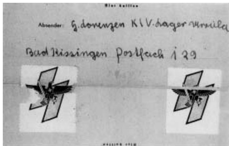
Abb. 5. Ein Faltbrief mit NS-Siegelmarken. Winter 1944/45