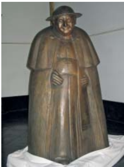
Abb. 2. Statue von Papst Johannes XXIII. im Papst-Johannes-Haus; 2007

Das junge Bistum Aachen muss 1930 mit dem Aufbau einer Verwaltungsstruktur beginnen, als die nationalsozialistische Herrschaft aufkommt. Bischof Johannes Joseph van der Velden übernimmt am 7. September 1943 die Leitung einer Diözese, die nach den Kämpfen an der Westfront einem Trümmerhaufen gleicht. Der Wiederaufbau des Gemeindelebens, der Kirchen, Pfarrhäuser, Schulen steht an. Unermüdlich bereist er seinen Sprengel. Mit dem Beinamen „Siedlungsbischof“ kennzeichnen die Bürger seine Förderung des Siedlungsbaus. Bei einer Visitation der Pfarrgemeinde Liebfrauen in Krefeld stirbt er am 19. Mai 1954. Die von ihm