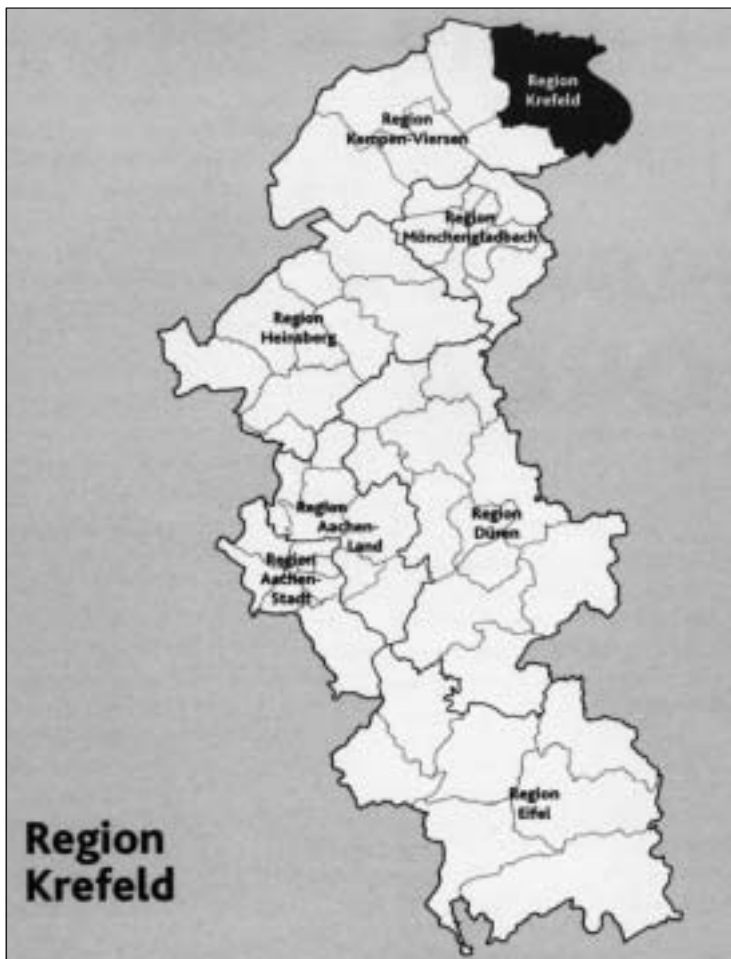
Abb. 4. Karte der Regionen des Bistums Aachen

67, S. 168). Weiter regeln diese Richtlinien die Struktur der Priester- und Seelsorgeräte, der Katholikenausschüsse, Pfarrgemeinderäte und des Diözesanrates der Katholiken. Die aktive Mitarbeit von Frauen und Männern auf den unterschiedlichen Arbeitsfeldern der „Kirche in der Welt von heute“ 8 erhält eine neue zentral orientierte Ordnung.