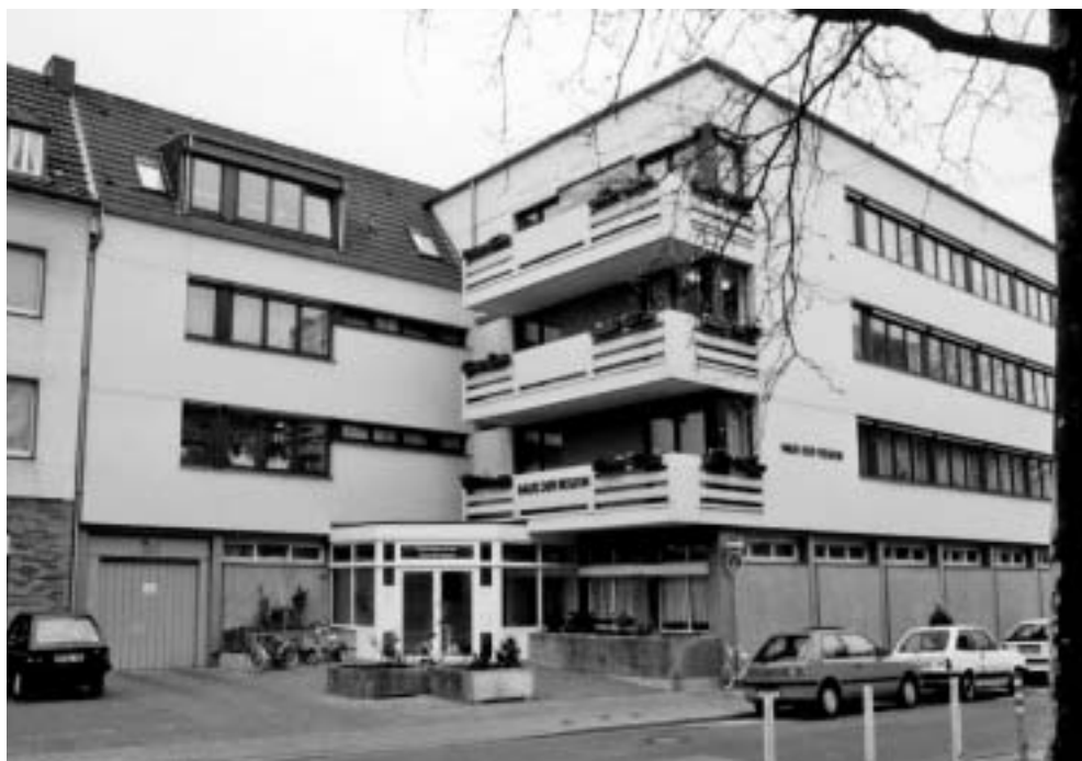
Abb. 1. Das Haus der Region; 1993