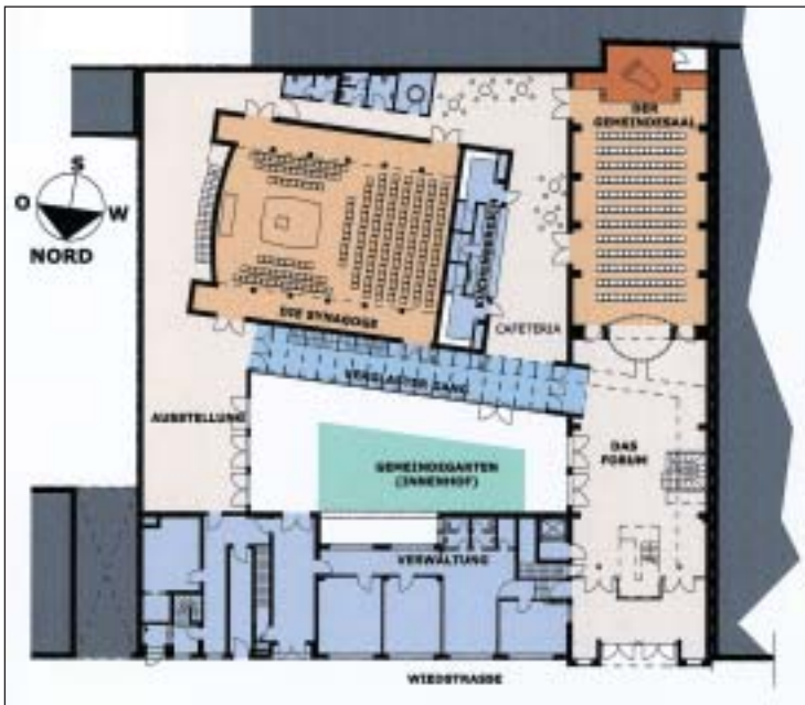
Abb. 10. Neben der Synagoge enthält das Zentrum ein großes Forum und einen Gemeindefaal.