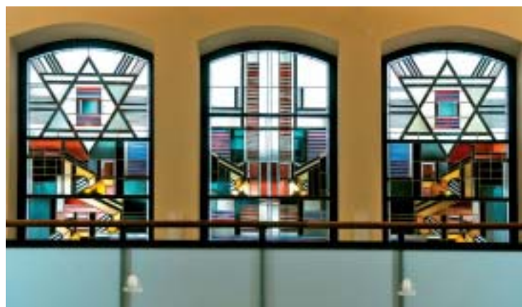
Abb. 9. Da die Entwürfe erhalten waren, konnten die Prikker-Fenster jetzt nachgebaut werden.