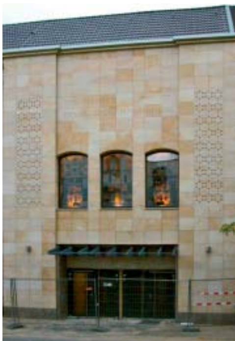
Abb. 13. Die drei Prikker-Fenster sind das Kennzeichen zur Straße

stein umgeben sind, auf der in Hebräisch die Zeile aufgebracht ist, die an der Synagoge an der Petersstraße die Gläubigen begrüßte: „Herr, ich liebe Deines Hauses Stätte und den Ort, wo Deine Herrlichkeit thront.“ Darunter findet sich in halber Schrifthöhe die deutsche Übersetzung.