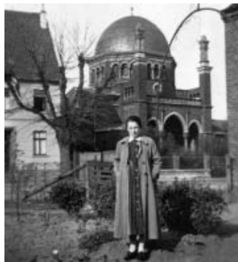
Abb. 6. Auffallend war der orientalische Stil der Linner Synagoge.