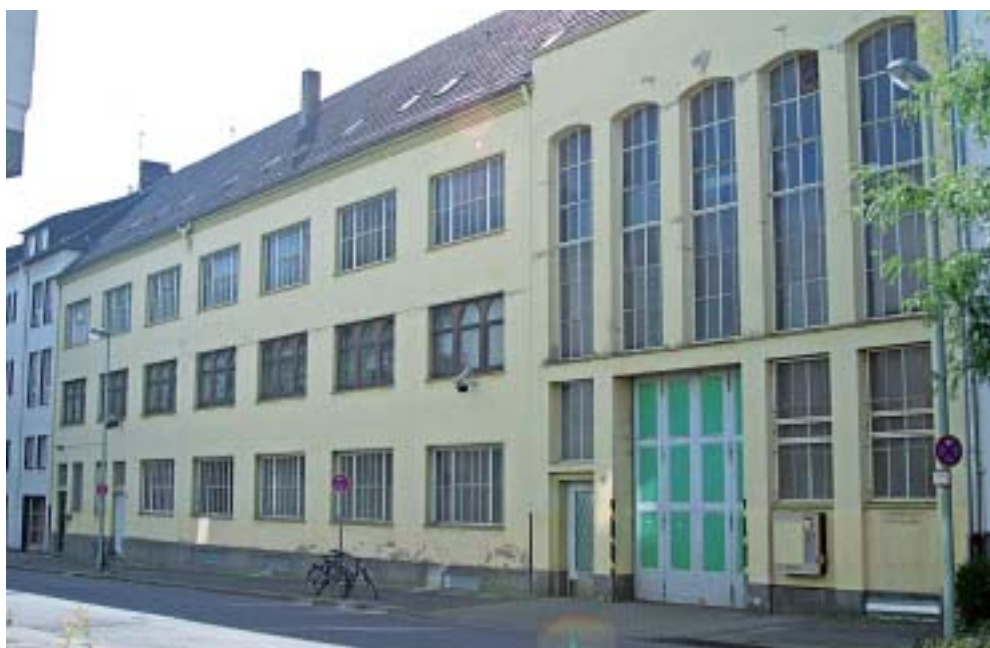
Abb. 1. Ein schlichter Fabrikbau war das Gebäude an der Wiedstraße, das jetzt jüdisches Gemeindezentrum ist.