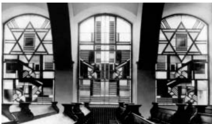
Abb. 8. Drei Fenster von Johan Thorn Prikker wurden 1928 in die Synagoge eingebaut.