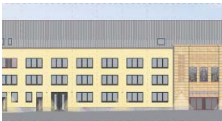
Abb. 2. Neben der beibehaltenen Fassade hebt sich der Eingang in hellem Sandstein ab.