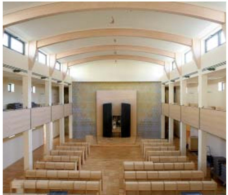
Abb. 11. In hellem Holz ist das Innere der Synagoge gestaltet, die Lichtbänder bringen Wärme.