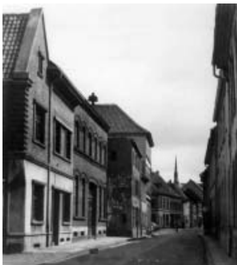
Abb. 5. Unscheinbar passte sich das Bethaus in Hüls ein.