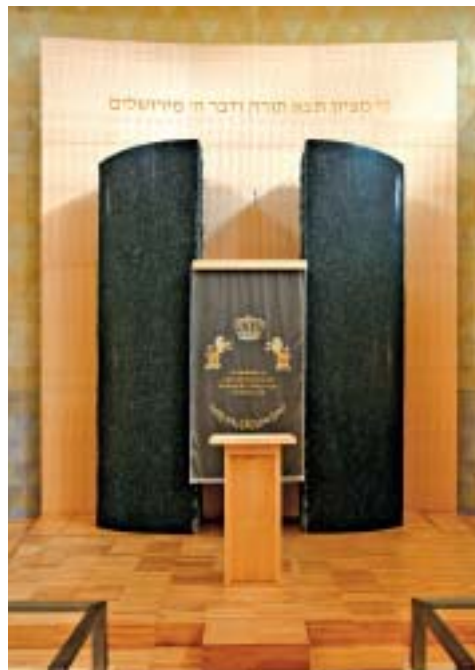
Abb. 12. Der Thora-Schrein ist durch Granit-Stelen eingefasst.

Zwischen dem Thora-Schrein und den Bänken für die Gläubigen steht die sogenannte Bima, ein Teil deren das Lesepult ist, auf dem die ausgebreitete Thoraschrift gelesen wird. Zwei Treppen außerhalb der Synagoge führen zur Empore, die traditionell den Frauen vorbehalten ist. Eine der beiden Treppen steigt aus dem verglasten Gang auf, der sich zwischen Synagoge und dem Innenhof befindet. Um die Synagoge herum gruppieren sich im