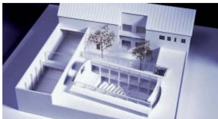
Abb. 3. Das Modell zeigt deutlich die nach Jerusalem ausgerichtete Lage der Synagoge.