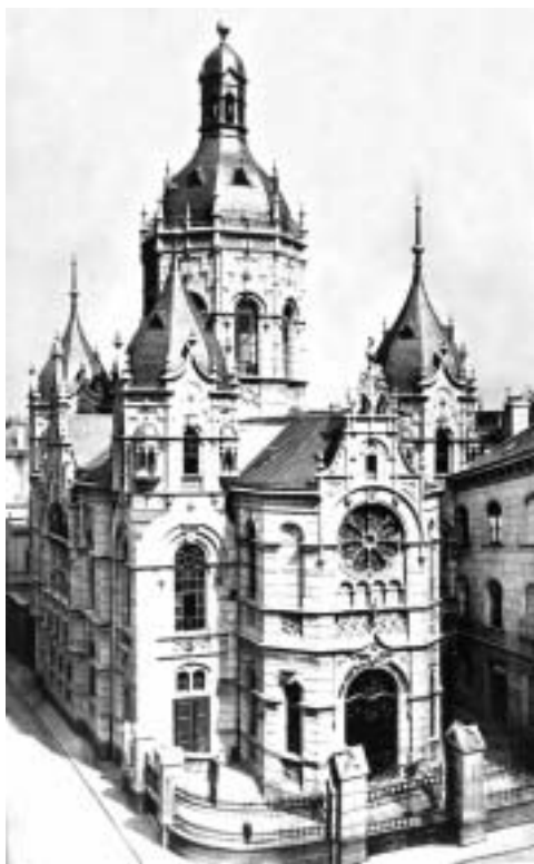
Abb. 7. Ein prächtiger Bau war die Synagoge an der Petersstraße.

der bedeutendsten Architekten und Schüler von Carl-Friedrich Schinkel, dem führenden preußischen Architekten in Berlin.