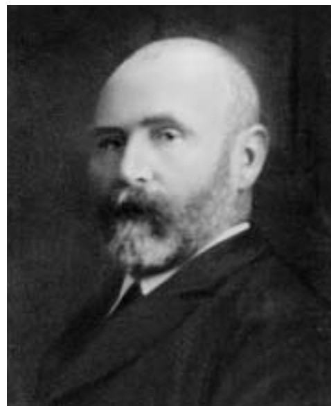
Abb. 2. Johann Heinrich Opdenberg * 12. Mai 1858 in Kaldenkirchen † 29. Juli 1921 in Krefeld

Straße zugeschüttet. Einen Plan aus dieser Zeit bekam ich von Nachbarn geschenkt, die das Haus gut 30 Jahre später gekauft hatten. Am 7. April 1900 wird das achte Kind geboren und nach den Unterlagen des Standesamtes haben sie schon vier davon begraben müssen. Wirtschaftlich scheint es mit dem kleinen Unternehmen, trotz großer wirtschaftlicher Turbulenzen in der Stadt, weiter bergauf zu gehen.