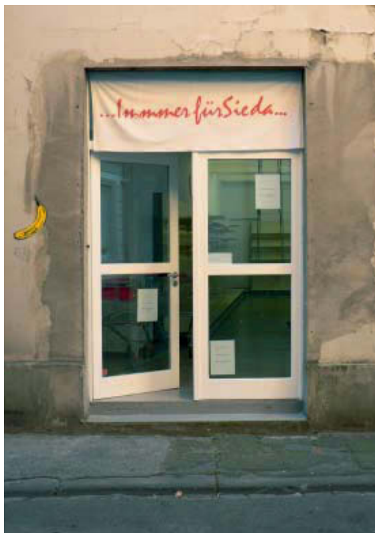
Abb. 2. „... Immer für Sie da ...“, Eingang Galerie Fochem