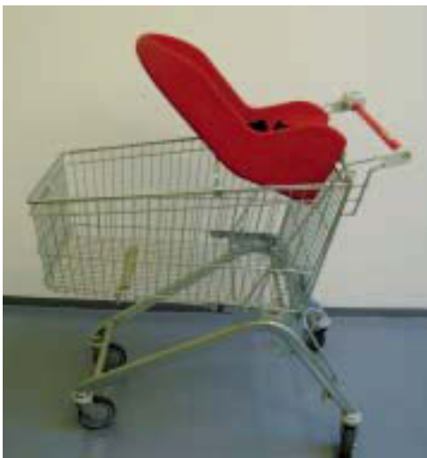
Abb. 5. Einkaufswagen mit Kindersitz. 2006. Metall, Kunststoff. Installationsansicht Galerie Fochem

In diesem Sinne entwickelte die Künstlerin im Rahmen von KIK, Kunst in Krefeld, 2006 eine parallel verlaufende, sich ergänzende Doppelausstellung an zwei Orten, die unter dem Titel „... Immer für Sie da...“ einem essentiellen menschlichen Bedürfnis nachspürte. (Abb. 1) Das Stadtarchiv Krefeld, das sich seit 1997 als „untypischer“ Ort für Ausstellungen am früher sogenannten Galerisonntag beteiligt, sowie die Galerie Christian Fochem, seit vielen Jahren etablierte Adresse für zeitgenössische Kunst in Krefeld, nutzte Nelles