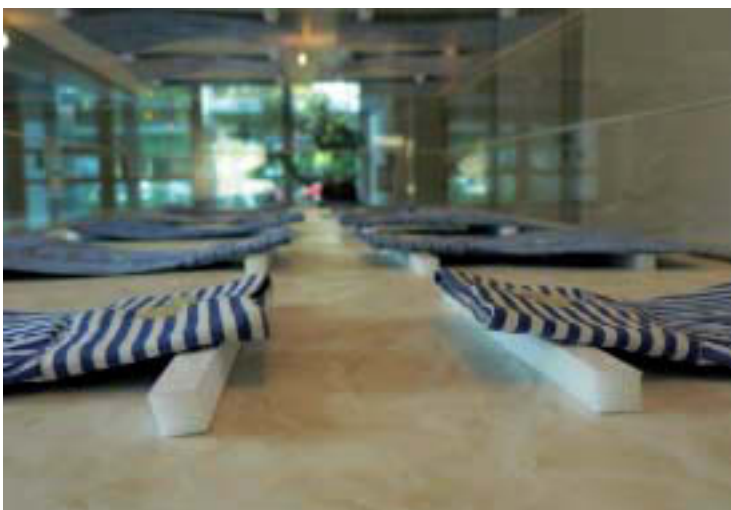
Abb. 7. 10 abgeschnittene Hemdsärmel. 2006. Stoff, Sockel, Marmorimitat. Installationsansicht Stadtarchiv Krefeld

Verhältnis zur üblichen Ernsthaftigkeit von Schauobjekten stand. Nelles steigerte diesen Widerspruch an anderer Stelle, indem sie eine weitere Vitrine mit zehn abgeschnittenen Hemdsärmeln bestückte. (Abb. 7) Den üblichen Eindruck von großer Bedeutsamkeit der unübersehbar banalen Dinge verdichtete die Künstlerin durch aufwändige Umnähte sowie die Präsentation der Manschetten auf Auflagenstäben, wie sie sonst für wertvolle Objekte genutzt werden. Das, wie auch die Unterlage aus Marmorimitat verleitete den Betrachter, Begriffe wie Sinn und Unsinn, Wert und Wert-