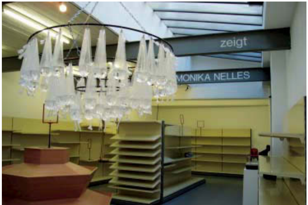
Abb. 4. Kronleuchter. 2006. Metall, Plastiktüten, Wasser. Installationsansicht Galerie Fochem

In diesem Sinne entwickelte die Künstlerin im Rahmen von KIK, Kunst in Krefeld, 2006 eine parallel verlaufende, sich ergänzende Doppelausstellung an zwei Orten, die unter dem Titel „... Immer für Sie da...“ einem essentiellen menschlichen Bedürfnis nachspürte. (Abb. 1) Das Stadtarchiv Krefeld, das sich seit 1997 als „untypischer“ Ort für Ausstellungen am früher sogenannten Galerisonntag beteiligt, sowie die Galerie Christian Fochem, seit vielen Jahren etablierte Adresse für zeitgenössische Kunst in Krefeld, nutzte Nelles