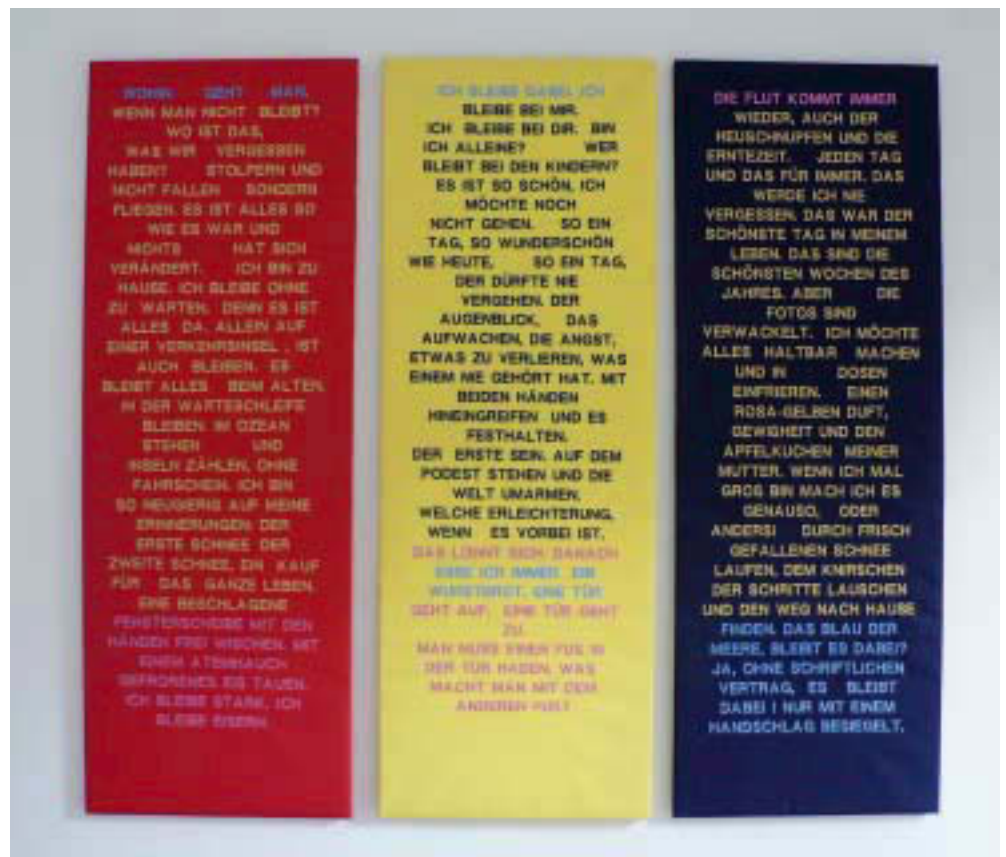
Abb. 10. ICH BLEIBE. Triptychon. 2005. Text von Monika Nelles maschinell auf Baumwolltuch gestickt. 130 x 138 cm. Installationsansicht Stadtarchiv Krefeld

„...Immer für Sie da...“ klingt nach einem Versprechen, nach Geborgenheit, Sicherheit und der Erfüllung von Sehnsüchten. Bekannt aus der Warenwelt vermittelt die Behauptung den Eindruck, sämtliche menschliche Bedürfnisse über den Erwerb von Gegenständen zu erfüllen. Zugleich werden Gefühle mobilisiert, Erinnerungen wach an die Kindheit, in der Träume erwachen und auch wieder verblasen. Denn „...Immer für Sie da...“ ist eine Lüge, ein unmoralisches Angebot aus der Welt des Konsums. Es kann seinem eigenen Versprechen nie nachkommen, auch wenn