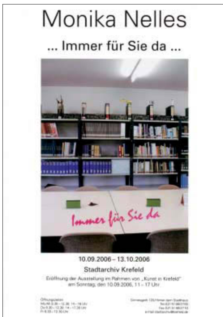
Abb. 1. „... Immer für Sie da ...“, Ausstellungsplakat

oder zu spüren ist, doch fordert sie den Betrachter auf, die Einfachheit der Dinge auch wirklich zu erkennen. „Dass eine Blume nur schön sein kann, ist für viele Menschen heute unwesentlich“, bedauert die Künstlerin, „sie müsste mindestens fünf Sprachen sprechen“. Als Reaktion darauf entstehen Werke, die Monika Nelles' Wunsch nach einer Betonung einfacher, aber wesentlicher Erfahrungen spiegeln.