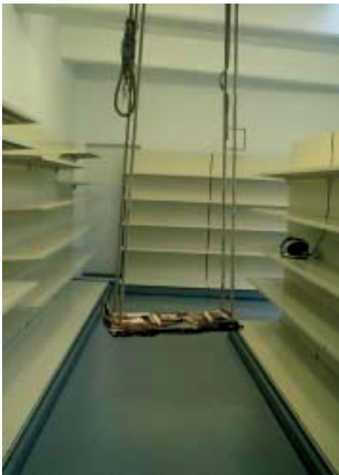
Abb. 3. Schaukel. 2006. Holz, Hirschgeweih, Seil. Installationsansicht Galerie Fochem