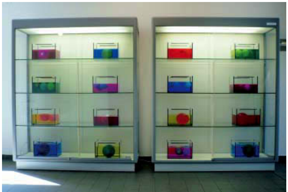
Abb. 6 . Glasvitrinen. 2006. 16 Glasbehälter, gefärbtes Wasser, gefüllte Ballons. Installationsansicht Stadtarchiv Krefeld

Vergleichbar und doch über einen anderen Ansatz ermöglichte der Beitrag von Monika Nelles für das Stadtarchiv Krefeld dem Besucher eine ähnliche Erfahrung. Der Leere des Supermarktes antwortete die Installation im Stadtarchiv mit einer opulenten Fülle von Gegenständen, Objekten und Malereien, die zwar „konsumiert“ aber nicht im merkantilen Sinne ver- oder gekauft werden konnten. Vielmehr stellte Nelles auch hier die Frage nach der eigentlichen Bedeutung von Inhalten, indem sie den Charakter des Ausstellungsortes