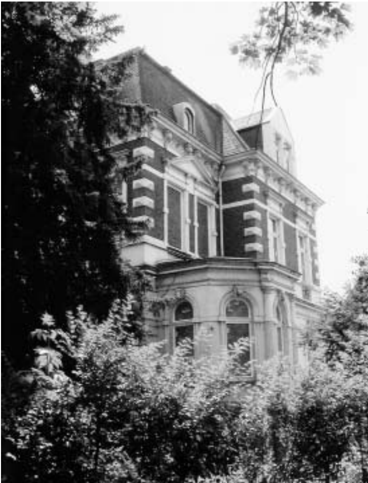
Abb. 1. Nordost-Ansicht

Eckgebäude, das seit seiner frühesten Jugend in Krefeld zu seinen Wunschhäusern gehört und erwirbt es im Sommer 2002. Noch im gleichen Jahr erkennt das Rheinische Amt für Denkmalpflege die Denkmalwürdigkeit der Villa Goecke an, nachdem der neue Besitzer zügig mit dem Ausräumen und Freilegen der völlig überwucherten Oberflächen begonnen hat. Da die originalen Pläne vom Vorbesitzer übernommen werden konnten, sind inzwischen die Haupträume wieder in ihren ursprünglichen Zustand versetzt, Verkleidungen sind entfernt, Türen gefunden, Fenster zurückgebaut, und außerdem ist der Giebel ergänzt und restauriert worden. Wiederherzustellen sind noch Nebenräume, so dass auf sicherem Boden das „work in progress“ fortgeführt werden wird.