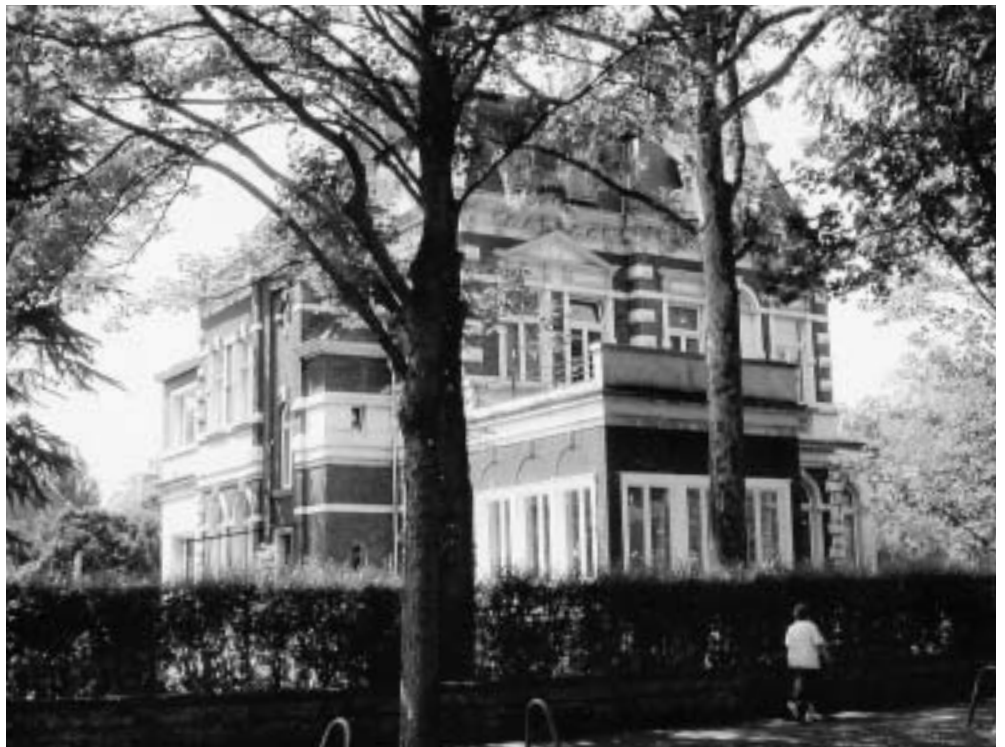
Abb. 2. Südost-Ansicht

Ich fand dann bei der ersten Hausbesichtigung einen sehr verblüfften Immobilienhänd-