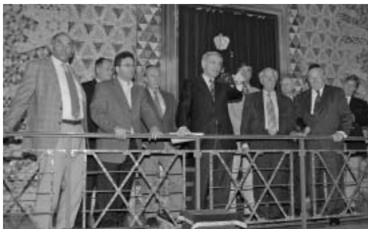
Abb. 7. Der Vorstand der jüdischen Gemeinde und Mitglieder der Hirschfelder-Stiftung informieren sich in der Frankfurter Synagoge über das Konzept der Inneneinrichtung eines jüdischen Bet- und Versammlungssaales.