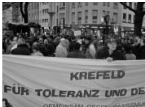
Abb. 2. Mehrmals demonstrieren Krefelder gegen Auftritte von Rechtsextremen, die mit mehreren Aktionen in Krefeld erproben wollen, ob die Stadt der richtige Rahmen für sie ist.