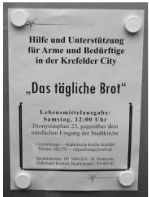
Abb. 5. Sind die fetten Jahre vorbei? Der Aushang an der Dionysiuskirche kündigt regelmäßige Lebensmittelverteilung an Bedürftige an.