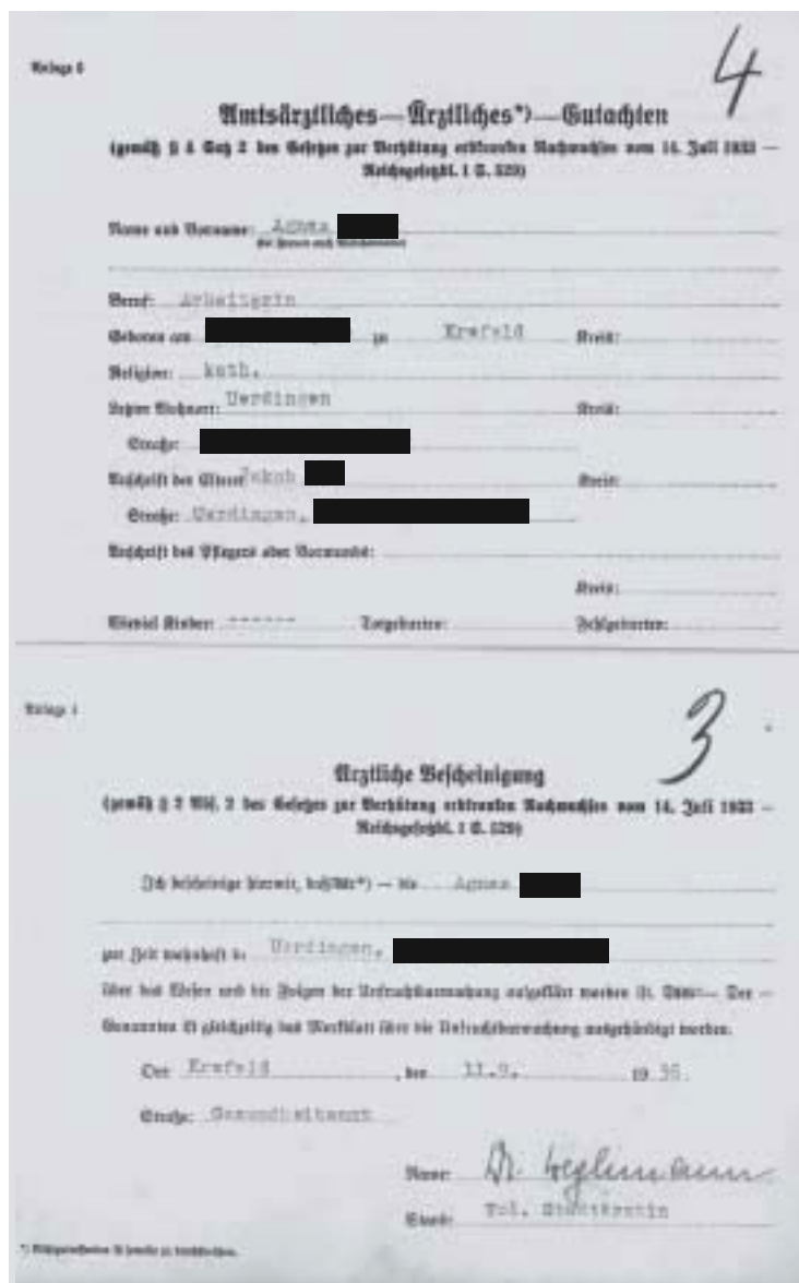
Abb. 3. Amtsärztliches Gutachten, aus Akte 137