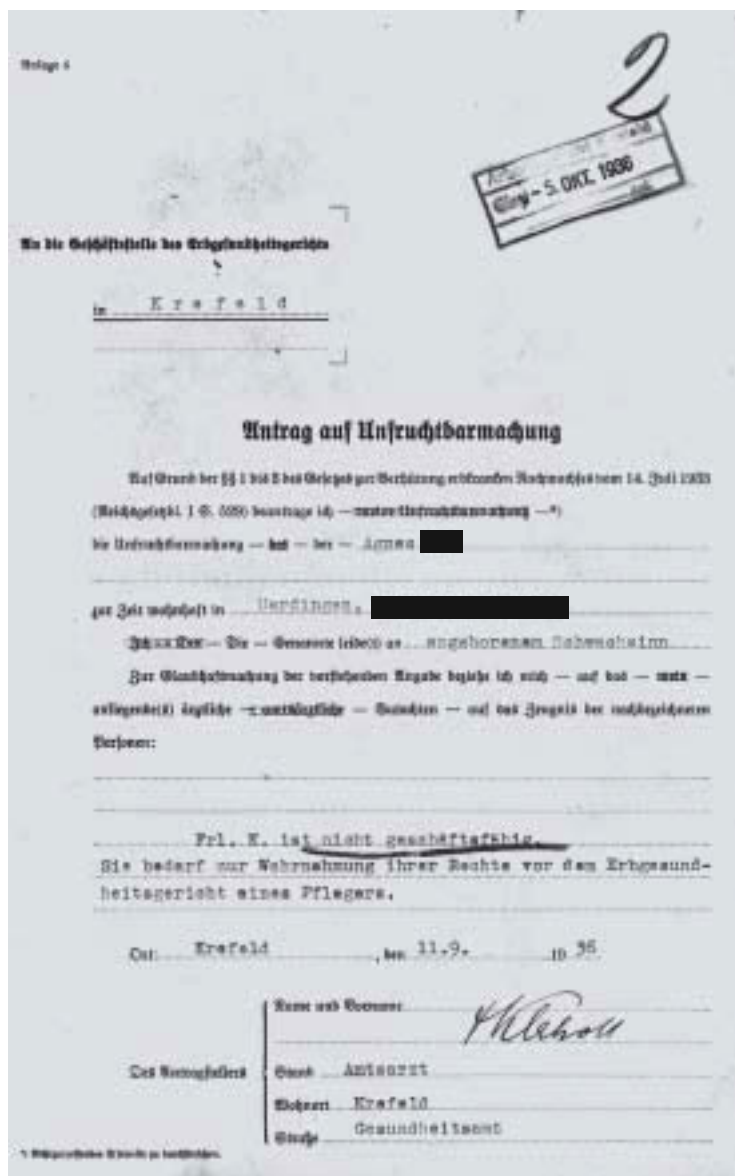
Abb. 2. Antrag auf Unfruchtbarmachung, aus Akte 137

Das amtsärztliche Gutachten setzte sich aus einer Untersuchung der körperlichen Konstitution, also einem medizinischen Gutachten