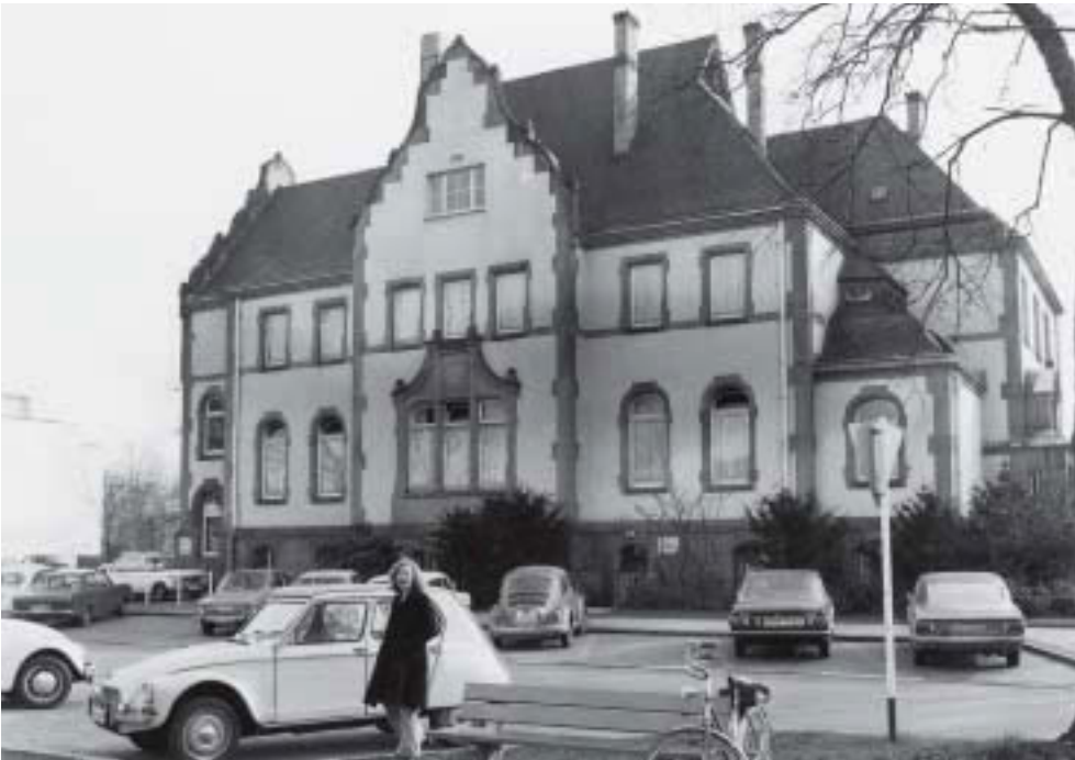
Abb. 7. Ehemaliges Offizierskasino der Husaren. Ab 1935 Sitz des Gesundheitsamtes; 1975

der Oberbürgermeister; der örtliche Amtsarzt war weisungsbefugt. In der Weimarer Zeit lautete die Berufsbezeichnung „Wohlfahrts-pflegerin“. In den Akten wird daneben auch mit „Volksfürsorgerin“ unterschrieben. Frauen dieser Berufsgruppe arbeiteten in „vorderster Linie“ – sprich: sie kontrollierten und observierten die Personen, die von Sterilisation bedroht waren. Das nachfolgende Dokument zeigt die Anzeige einer Fürsorgerin.