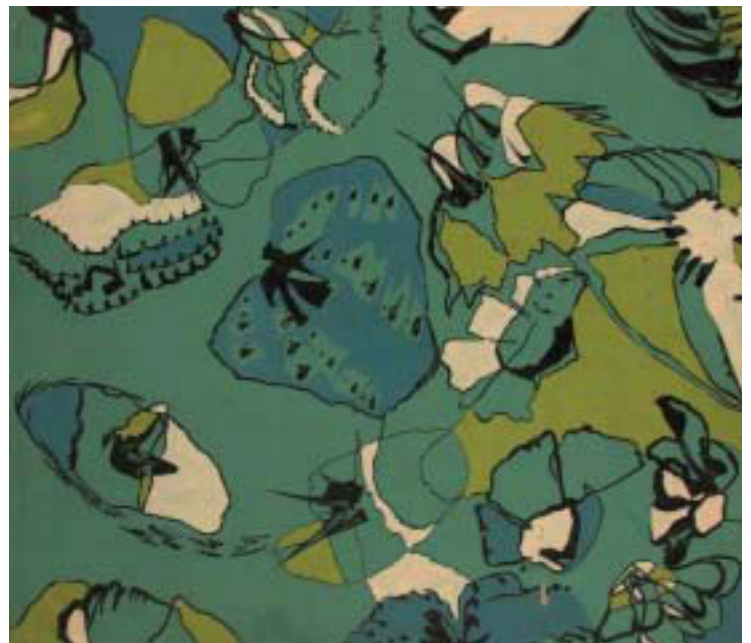
Abb. 6 – 7. Entwürfe aus dem Unterricht bei Elisabeth Kado