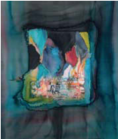
Abb. 5. Aquarell auf Seide – „Durchblick“, 1986