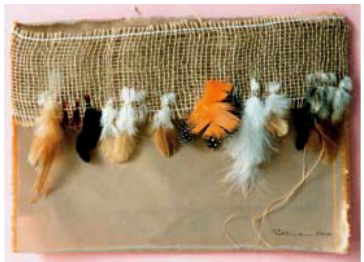
Abb. 2. „Federleicht“ 50 x 50; Seide / Jute / Federn