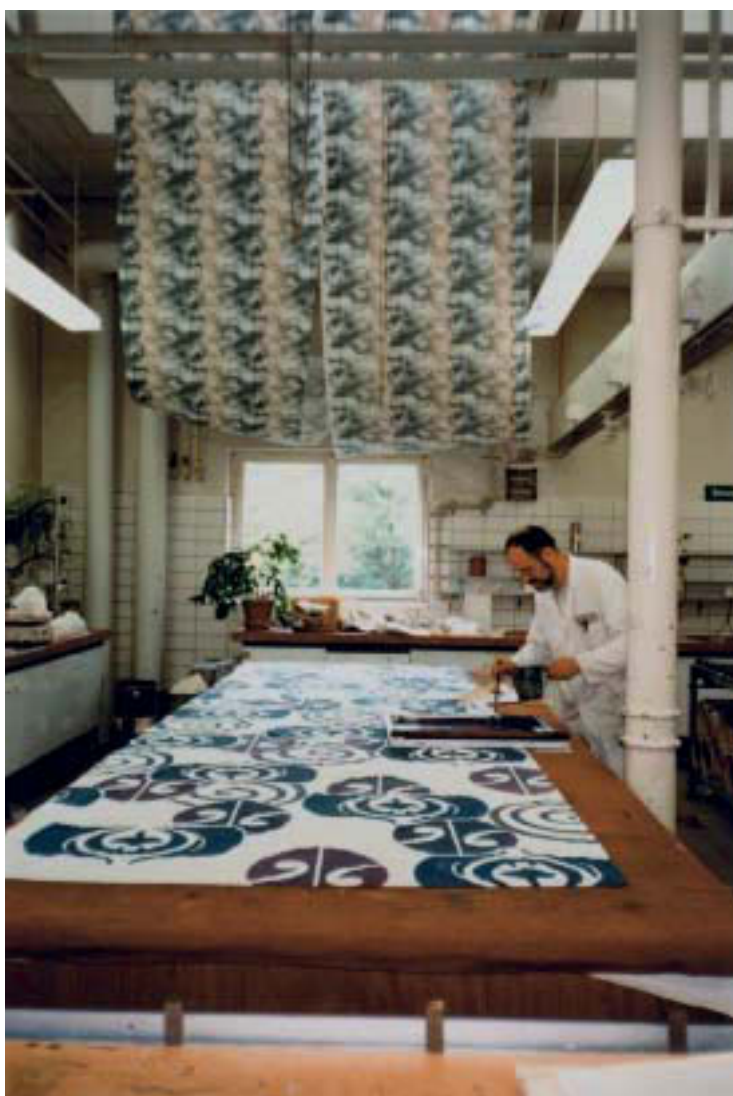
Abb. 3. Druckerei der Hochschule Niederrhein, ca. 1980