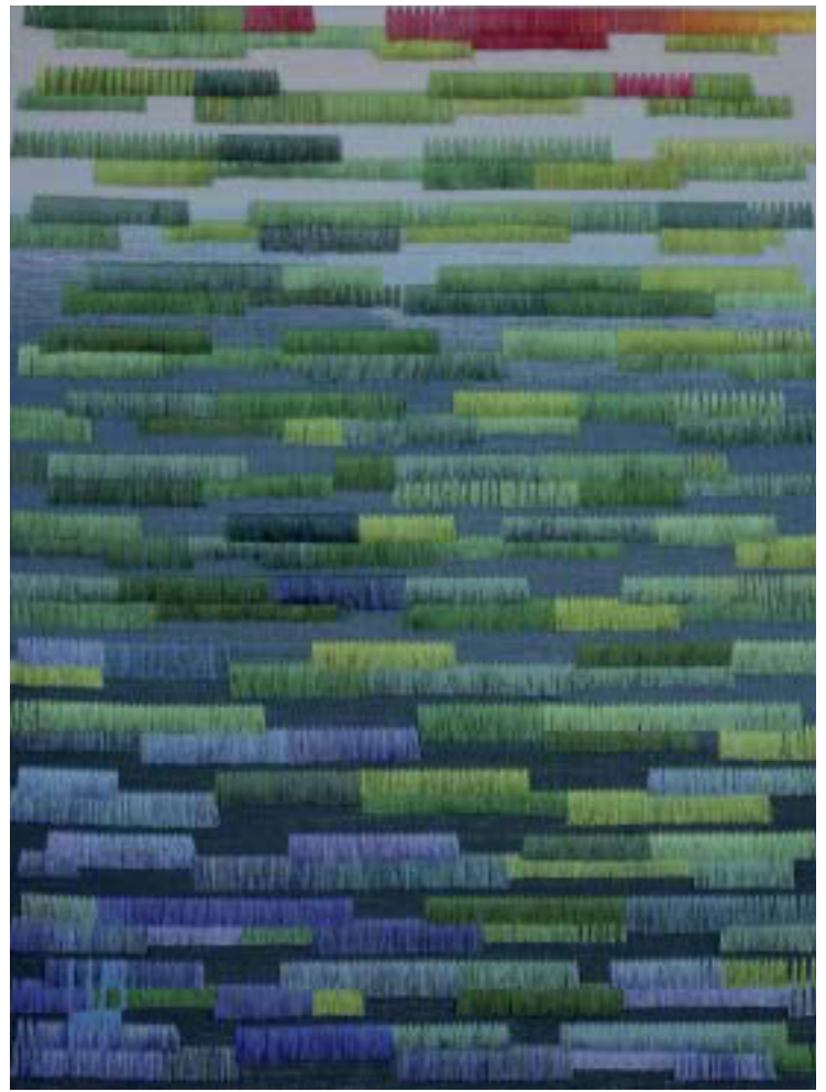
Abb. 4. Prisma: Grün, 1983