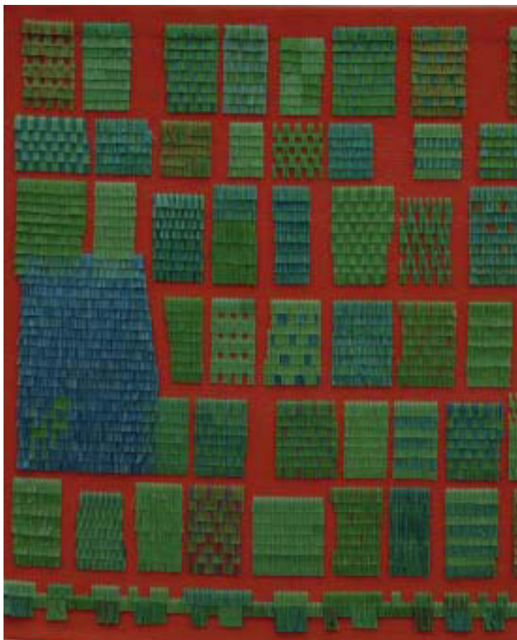
Abb. 7. Dorfteich, 1971