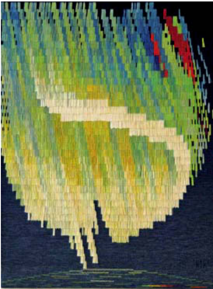
Abb. 3. Nordlicht, 2003