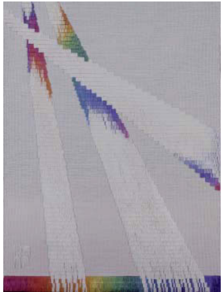
Abb. 6. Prisma: Weiß, 1984