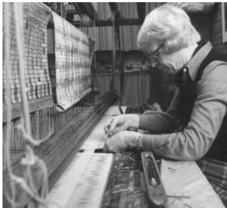
Abb. 2. Hildegard von Portatius am Webstuhl beim Knüpfen. Zwei verschiedene Bildteppiche entstehen nebeneinander, die Entwürfe auf Patronenpapier hängen vor den Schäften (1971)