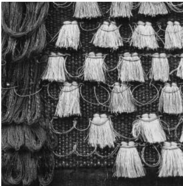
Abb. 9. Nächtliches Fest, 1974 (Ausschnitt)