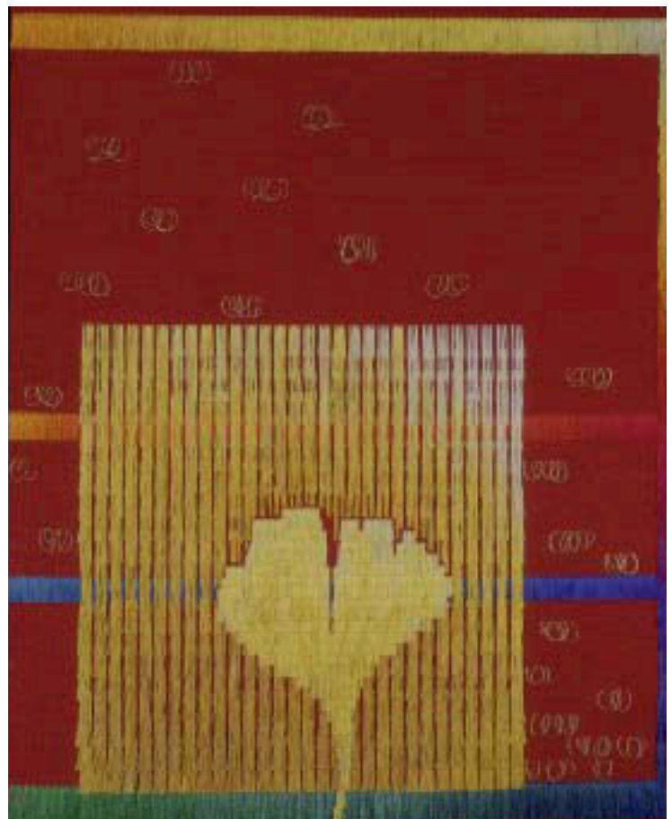
Abb. 8. Das goldene Blatt, 1997