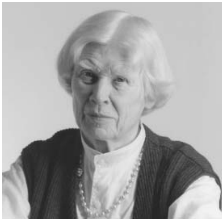
Abb. 1. Hildegard von Portatius, 1995

Das seit der Einführung des Maschinenwebstuhls im 19. Jahrhundert fast verdrängte Weberhandwerk war in den 1920er Jahren, vom Geist der Moderne getragen, wiederbelebt worden, an verschiedenen Kunstgewerbeschulen, etwa in Hamburg, und mit der größten Wirkung am 1919 in Weimar gegründeten Staatlichen Bauhaus. Ziel war dort die Verbindung von Kunst und Handwerk, erst später kam der Blick auf die industrielle Produktion hinzu. Seit 1920 gab es am Bauhaus eine Textilklasse und eine Webereiwerkstatt, die eine große Ausstrahlung entfalteten.