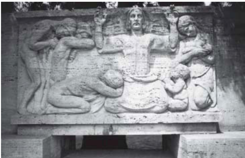
Abb. 5. Das Grabmal der Familie Hense

menschlicher Not bestimmen als ethische Grundzüge die Kunst Barlachs und führen mit gleichzeitiger Vereinfachung des Formalen zur zunehmenden Verinnerlichung des Ausdrucks. In der Zeit des Nationalsozialismus wurde Barlachs Kunst als „entartet“ aus den Sammlungen entfernt, beschlagnahmt und zum großen Teil zerstört, der Künstler selbst