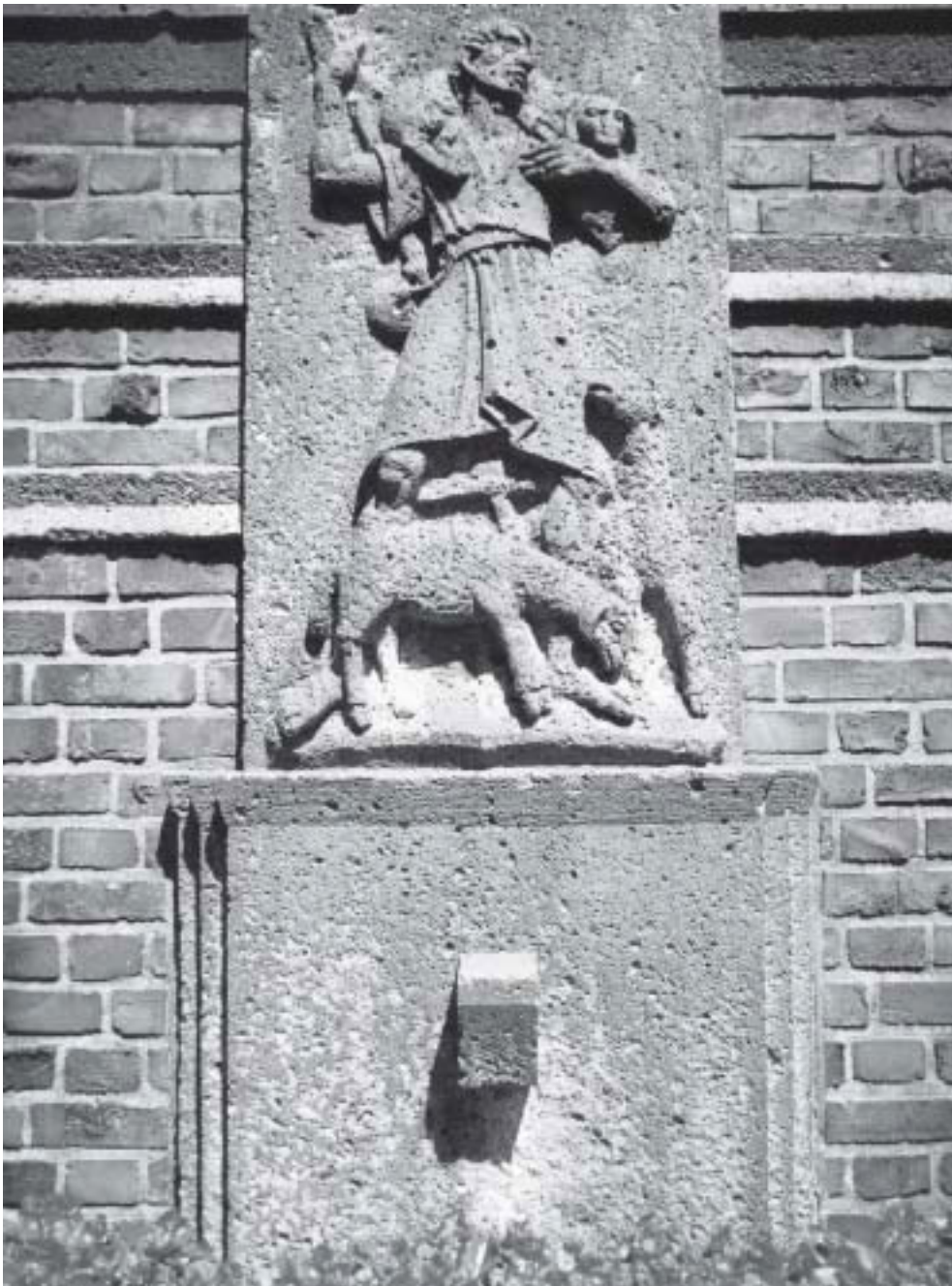
Abb. 2. Relief vom Grabmal der Pfarrfamilien