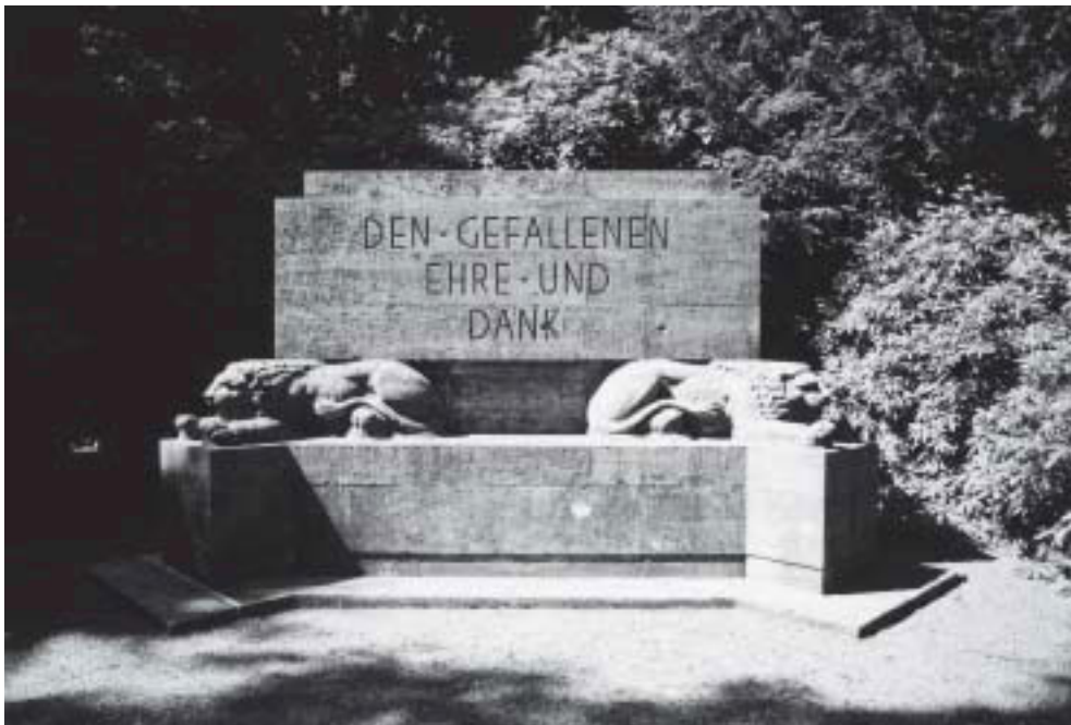
Abb. 3. Das Krefelder Krieger-Ehrenmal

berühmte Schauspielerin und Theaterintendantin Louise Dumont-Lindemann. Auf dem niedrigen Sockel, der die Inschrift trägt, sitzt eine blockhaft gestaltete Frauenfigur aus Muschelkalk. Die geschlossenen Augen in dem flächigen Gesicht, das unverkennbar die Züge der Künstlerkollegin Käthe Kollwitz trägt,