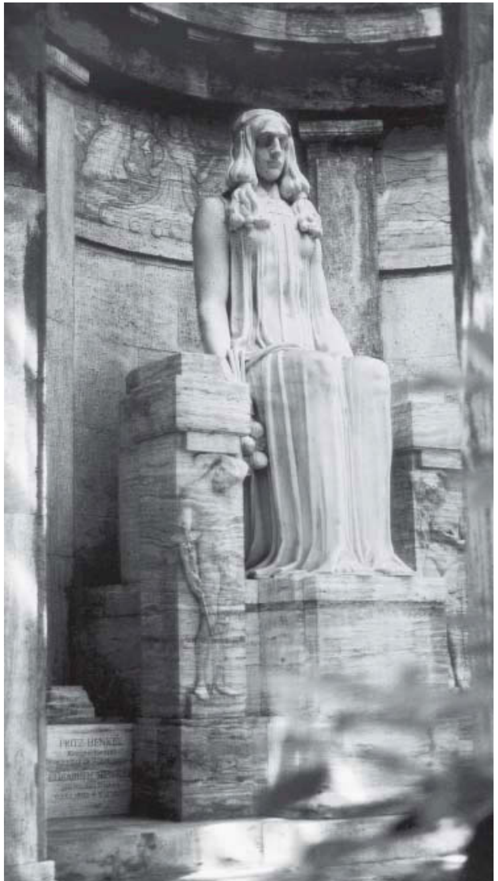
Abb. 8. Das Mausoleum der Familie Henkel