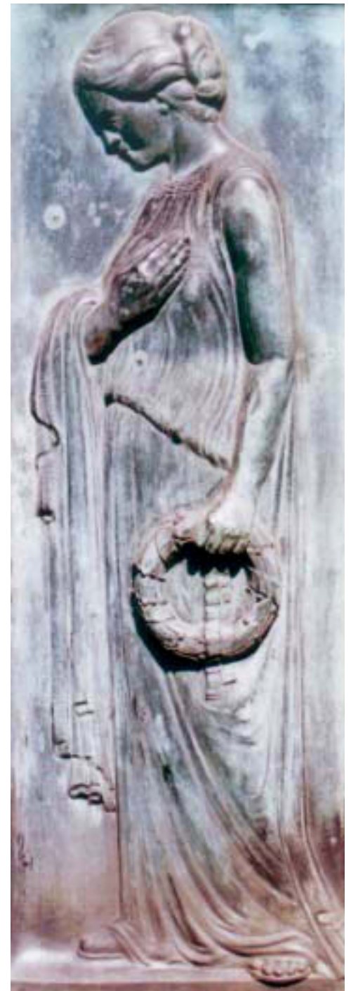
Abb. 4. Bronzerelief vom Grabmal der Familie Gronert

und die zwischen die Knie herabfallenden Hände drücken Entspannung und Ruhe aus, die der Tod dem schöpferisch Tätigen bringt. Auch in der Betonung des Materials entspricht die Figur der künstlerischen Forderung nach materialgerechter Form und Bearbeitung. Religiosität und starkes Mitgefühl mit