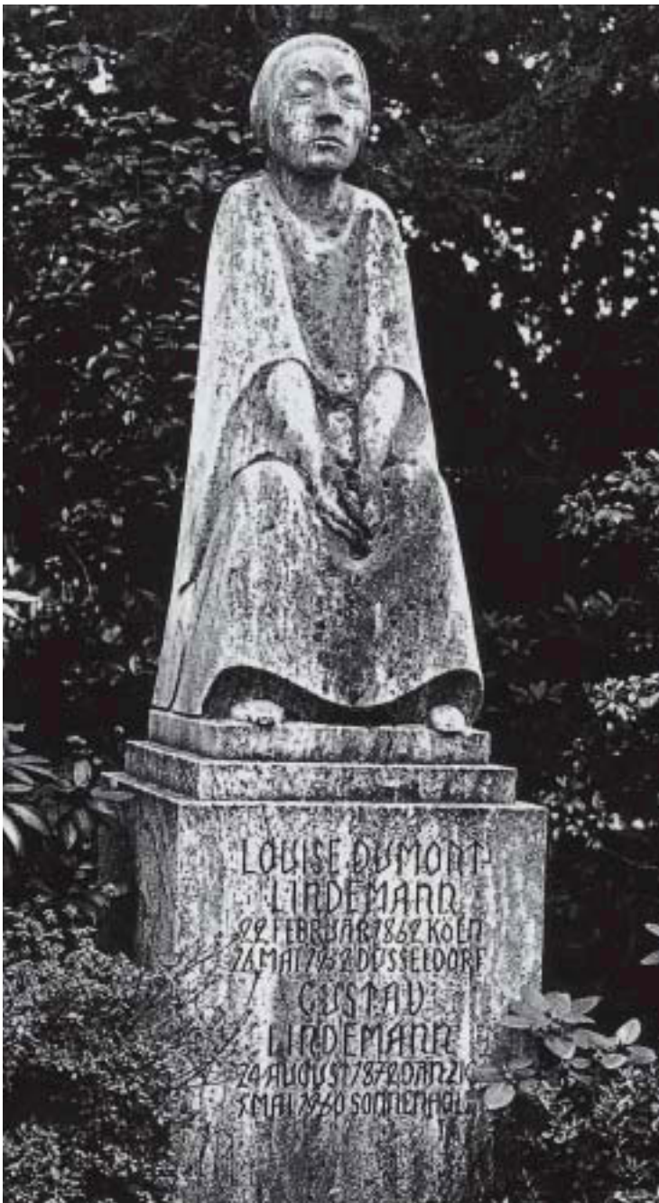
Abb. 6. Das Grabmal für Louise Dumont-Lindemann