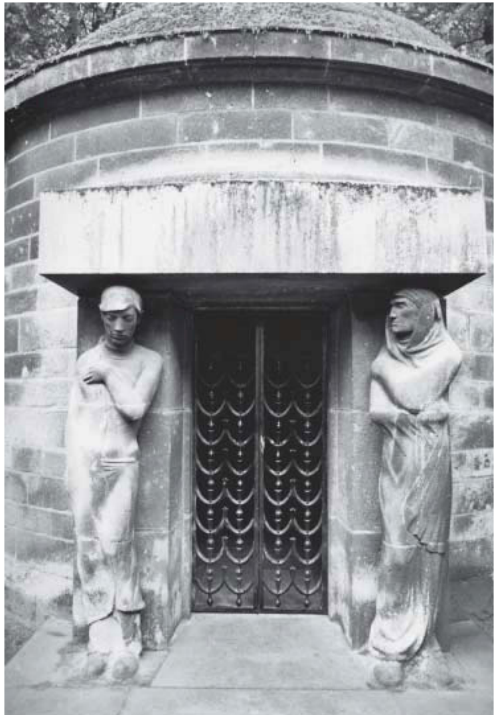
Abb. 1. Das Mausoleum der Familie Klöckner