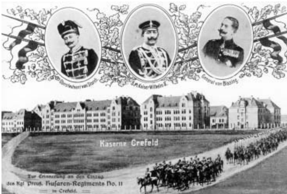
Abb. 7. Zum Einzug der Husaren entstanden viele Gedenkblätter und -postkarten, die an diesen Anlass erinnerten. Hier ist eine Montage mit der Ansicht der Kaserne an der heutigen Girmesgath.

musste. Innerhalb der so bedachten Behörden wurde inzwischen akribisch ermittelt, wer wohl die Ranghöchsten seien und damit ein Anrecht auf eine der wenigen begehrten Karten habe. Besoldungsgruppen und Dienstaltersstufen wurden genau durchleuchtet, um denjenigen herauszufinden, der am meisten Anrecht auf das begehrte Stück habe.