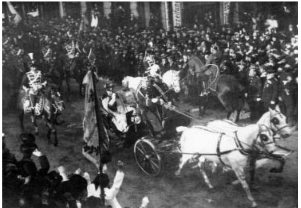
Abb. 8. Der Kaiser auf der Fahrt zum Stadttheater.

Am 2. August 1914 zogen die Husaren in den Krieg. Unter großer Anteilnahme der Bevölkerung marschierten sie zum Güterbahnhof, wo sie verladen wurden. Schon am folgenden