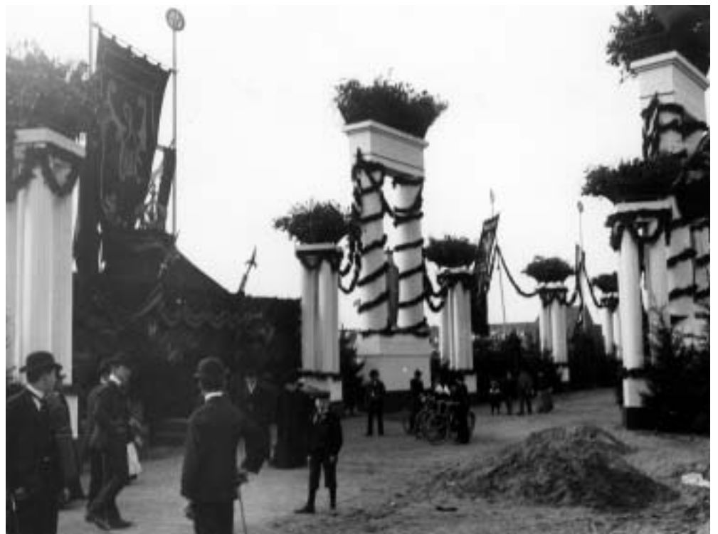
Abb. 2. Am Spröentalplatz wurde ein provisorischer Bahnhof aufgebaut, in dem der Kaiser würdig begrüßt werden konnte.