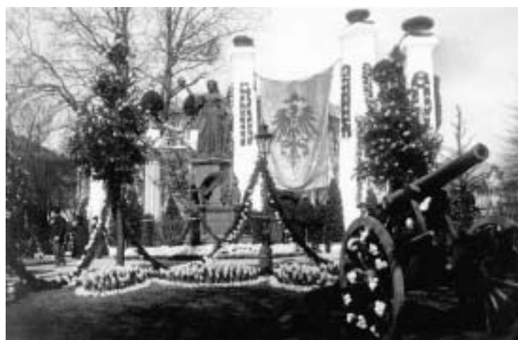
Abb. 6. Die Germania am Friedrichsplatz wurde ebenfalls patriotisch verziert.

scheiterte kläglich. Er bestand darauf, dass Ehrendamen anwesend sein müssen. Oehler rang sich letztendlich zu einem Kompromiss durch. Bei der offiziellen Begrüßung war eine Riege handverlesener neuer Ehrendamen anwesend und bei dem Theaterbesuch des Kaisers wurden diejenigen Ehrendamen von 1902, „die noch präsentabel“ waren oder wie Oehler es ausdrückte, die „sich im Glanze jugendlicher Schönheit noch sehen lassen konnten“, dem Kaiser vorgestellt.