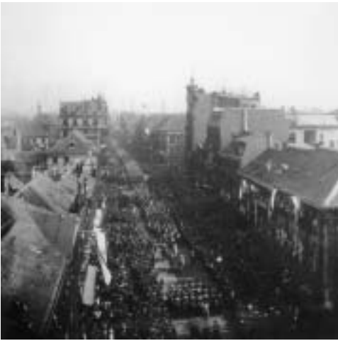
Abb. 3. Sogar auf den Dächern suchten die Schaulustigen nach einem guten Platz, um den Einzug der Husaren zu erleben.

Noch am gleichen Tag schickte der General der Kavallerie, Freiherr von Bissing, ein Telegramm: „Auf Befehl Seiner Majestät des Kaisers und Königs soll Krefeld Garnison erhalten. Ich bitte um baldige Vorschläge über Unterbringung eines Husarenregiments in der Stadt. Exerzierplatz in der Umgebung.“ 1 Krefeld stand daraufhin Kopf. Eine Welle der Begeisterung ging durch die Stadt. Am 27. Juni 1902 beschlossen die Krefelder Stadtverordneten in geheimer Sitzung, 4 Millionen Mark aufzubringen. Damit sollten neben einer Kaserne im damals noch unbebauten Kempener Feld ein Exerzierplatz auf dem Egelsberg und Schießstände im Hülser Bruch entstehen. 2