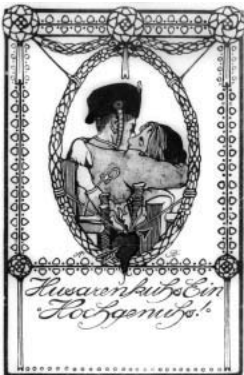
Abb. 1. Dass die Husaren nicht nur tanzen konnten, zeigt diese Postkarte.

Daher konnte die Militärverwaltung mit einer Verlegung der Husaren nach Krefeld die Rahmenbedingungen erheblich verbessern. Zudem waren nicht alle Städte so garnisonsfreundlich eingestellt wie Krefeld, denn der Bau der Kaserne oblag der Kommune selber. Eine reiche Stadt, wie es Krefeld damals noch war, konnte sich das aber leisten.