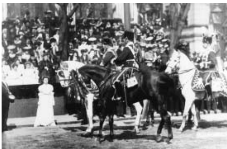
Abb. 5. Kaiser Wilhelm II. vor der Tribüne am Ostwall. Die ehrenvolle Aufgabe, den Kaiser mit einem Gedicht zu empfangen, fiel Ilse Oehler, der Tochter des Oberbürgermeisters, zu.