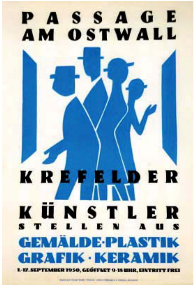
Abb. 27. Ernst Hoff, Plakat zur Ausstellung