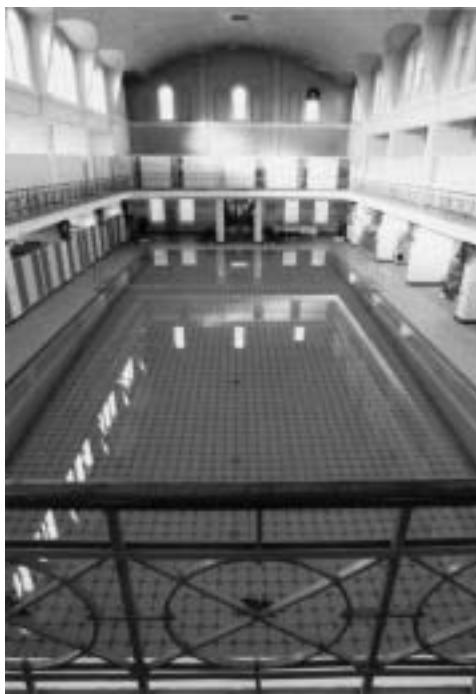
Abb. 1. Das Stadtbad Neusser Straße entgeht knapp dem sicheren Abriss für ein Einkaufszentrum.

en und St. Dionysius nach der Entwidmung der Norbertuskirche die Schließung von zwei weiteren Kirchen und Pfarrzentren. Die German Brass Academy mit ihren beliebten Konzerten, organisiert von der Musikschule, findet zum letzten Mal statt, weil die Sponsoren nicht mehr mitmachen. Stadtverwaltung und Feuerwehr bereiten den Neubau der seit vielen Jahren gewünschten neuen Feuerwache für den Standort Voltapplatz vor. Im Laufe der kommenden zwölf Monate ist allerdings von konkreten Fortschritten nichts zu vernehmen. Das Kinderheim „Kastanienhof“ erinnert daran, dass sein Haus an der Kaiserstraße vor 50 Jahren eröffnet wurde. Angesagter Party-Treffpunkt ist der „Meilenstein“, die Disko im ehemaligen Restaurant des Hauptbahnhofs. Seit Januar ist die Zahl der Krefelder Einwohner um 918 auf 239 402 gewachsen. Der britische Investor Slough Estates will an der Oberschlesienstraße, wo zeitweise ein