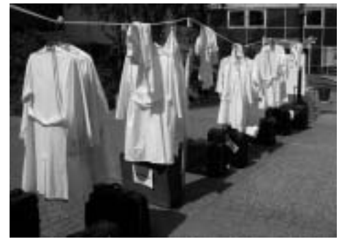
Abb. 5. Die Koffer sind gepackt. Die Kittel hängen an der Leine. Die Ärzte des Klinikums streiken und drohen mit Auswanderung.