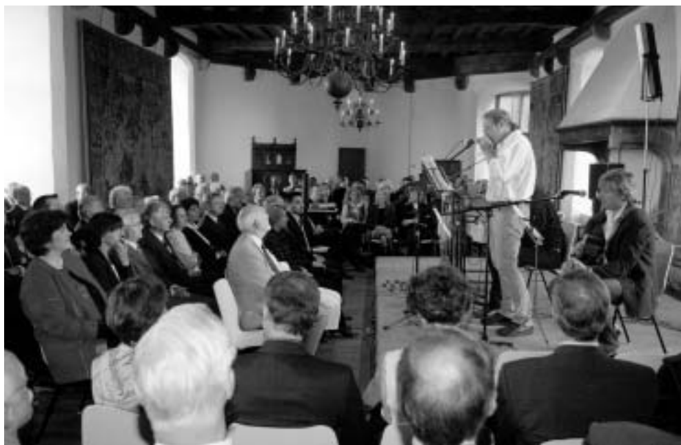
Abb. 2. Ausnahmsweise zeigt die Hochschule Niederrhein sich traditionsbewusst. Das 150jährige Bestehen des Fachbereichs Chemie wird im Rittersaal der Burg Linn gefeiert. Viel Beachtung findet eine Jubiläums-Ausstellung, die gleichzeitig im Linner Museum stattfindet.