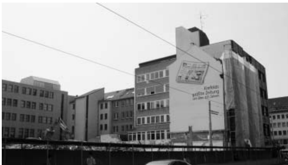
Abb. 4. Das Pressehaus an der Rheinstraße und die aus den Bombennächten des Krieges verbliebenen „Zahnlücken“ sind verschwunden. Auf dem Abbruchgelände werden rätselhafte Keller gefunden. Die Sparkasse Krefeld gönnt sich hier eine Erweiterung.